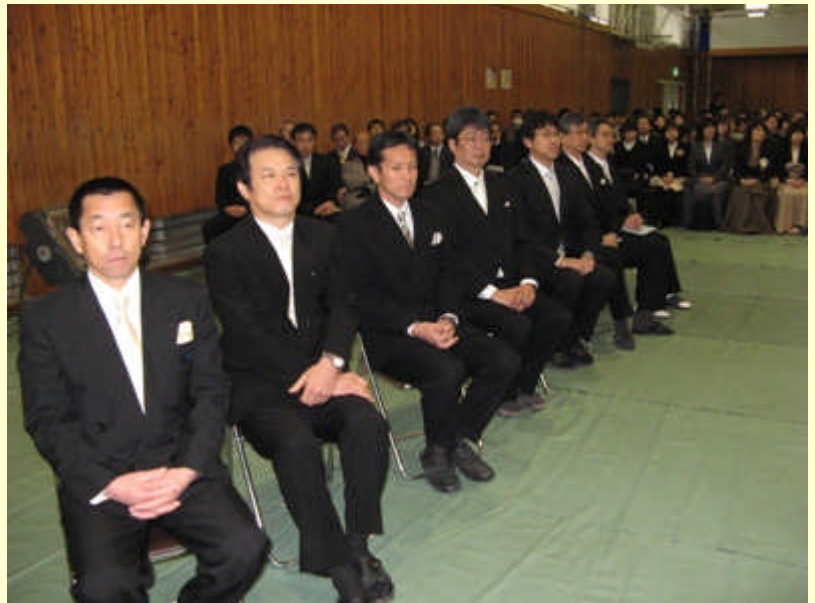
卒業学年担任団:3年間、おつかれさまでした。