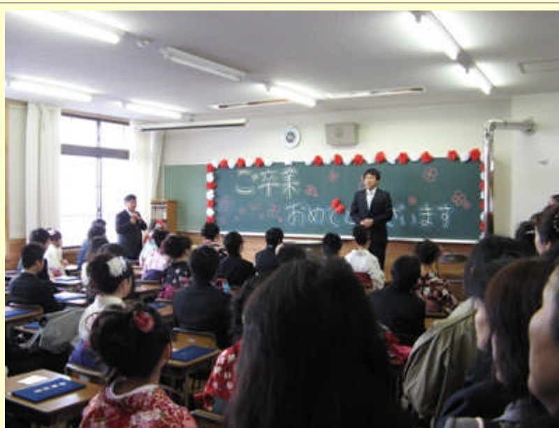
各クラス最後のLHRが始まりました。5組のようす

ご卒業おめでとうございます。みなさん のこれからのご活躍を職員一同お祈 ります。