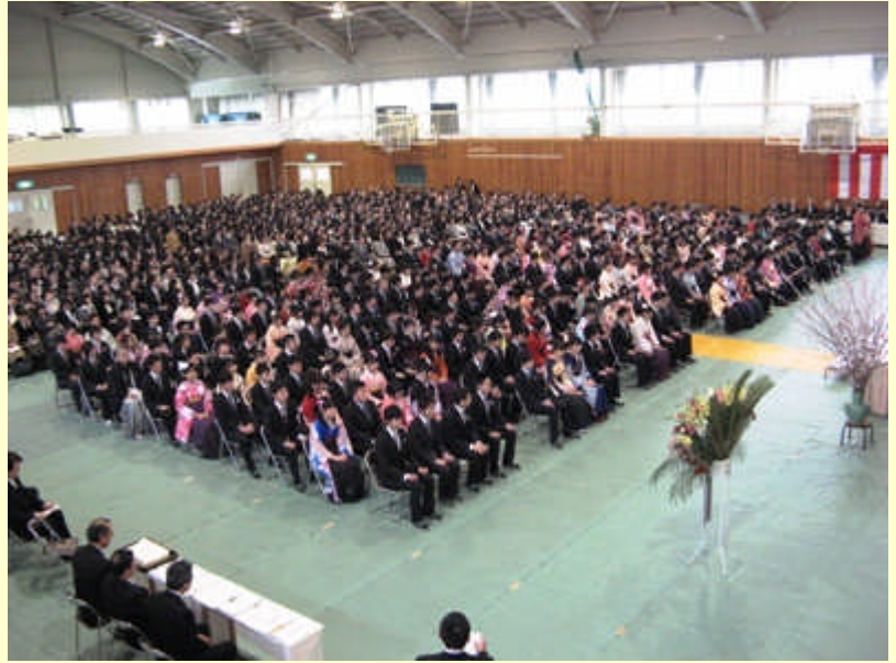
高校 64 回生の卒業式が間もなく始まります。