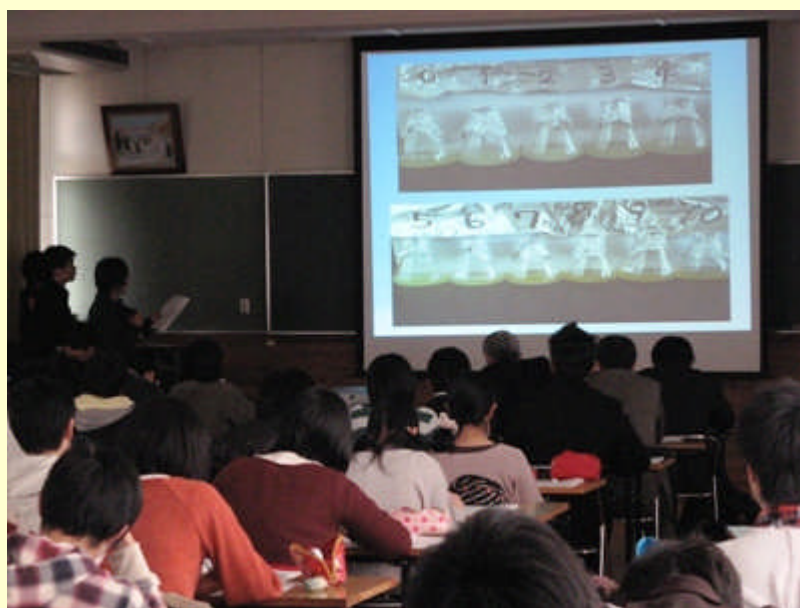
【写真】2、乳酸菌の性質 発表のようす