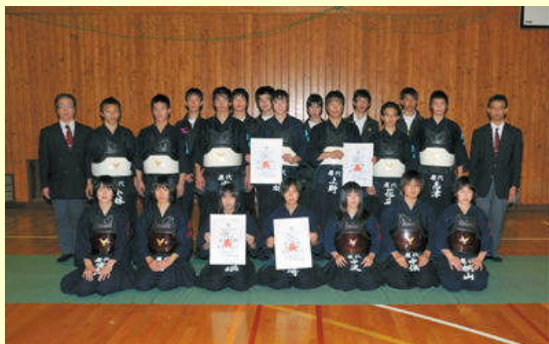
北信新人体育大会 2011年10月22日～23日 男子団体2位 女子団体3位