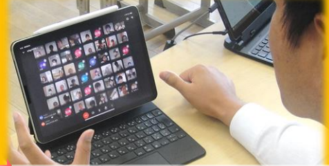
オンライン授業による在宅学習となりました(13日から通常に戻りました)