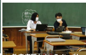
教育実習もオンラインで! 対話が生まれるように、質問を工夫して授業に臨みました。