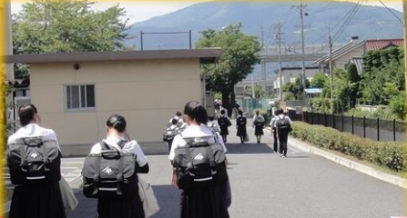
午前中で下校になる日が1週間続き…