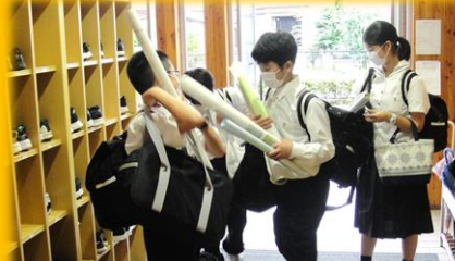
8月23日(月)の夏休み明けは、元気に登校しましたが…