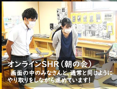
オンラインSHR(朝の会) 画面の中のみなさんと、通常と同じようにやり取りをしながら進めています!

マイクやチャット、共有の仕方等を工夫し、先生と生徒、生徒と生徒のかかわりが生み出せるよう、この期間、「双方向の授業づくり」にチャレンジしました!