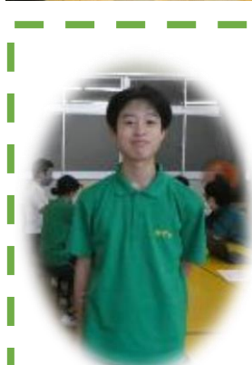
生徒会長 (南部小学校出身)

土曜日に、鳩中祭がありました。テストが終わって3日間、すごい追い込まれ方をしたなと個人的には思っています。その追い込まれ方で、いろいろテキパキできた面もあるし、バタバタした面もあると思います。