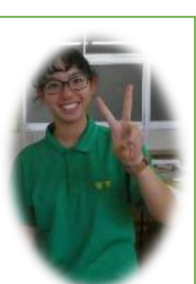
鳩祭実行委員長 (若槻小学校出身)