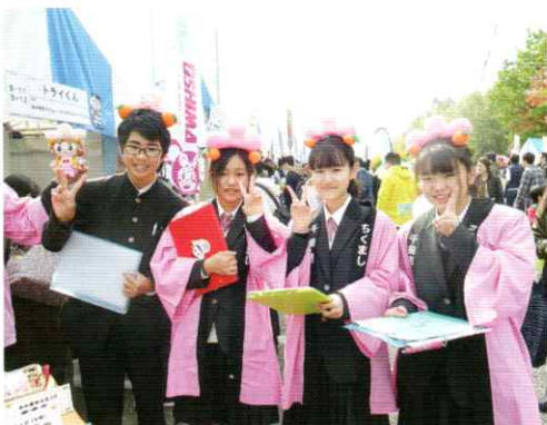
総合的な学習の時間での活動