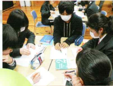
高校生と一緒に学ぶ